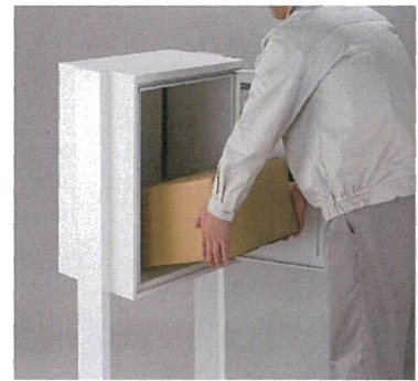
LIXIL「スマート宅配ポスト」

昨今の外出自粛要請などで自宅にいる時間がますます増えるとともに、今後、オンラインショッピングの機会は増えていくと考えられます。一方、受け取り時には新型コロナウイルスの感染リスクが懸念されます。このようななか、宅配ボックスを設置し、お持ちのスマートフォンと連携することで、荷物が届くとスマートフォンに通知され、カメラ機能で投函や取り出しの様子がリアルタイムで確認したり、応答したりすることもできます。家事の手を止めることなく、留守番中の子どもの代わりに受け取る事も可能になり、小さい荷物であれば、空きスペースに応じて複数の荷物を受け取りができます。